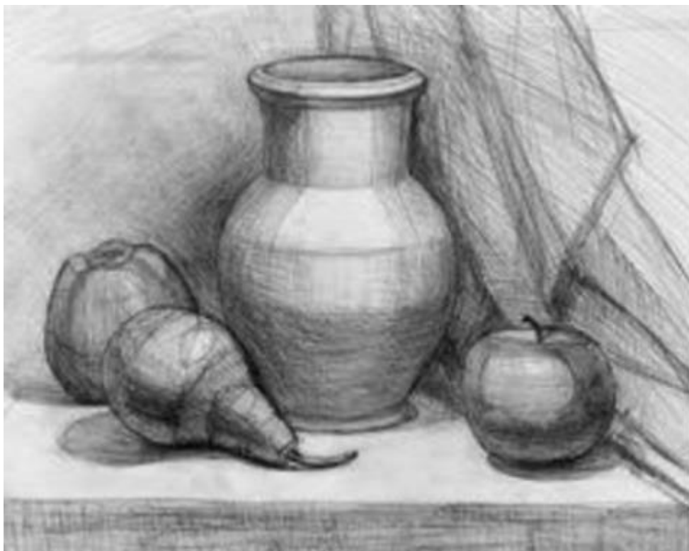
Рисунок 1. Натюрморт