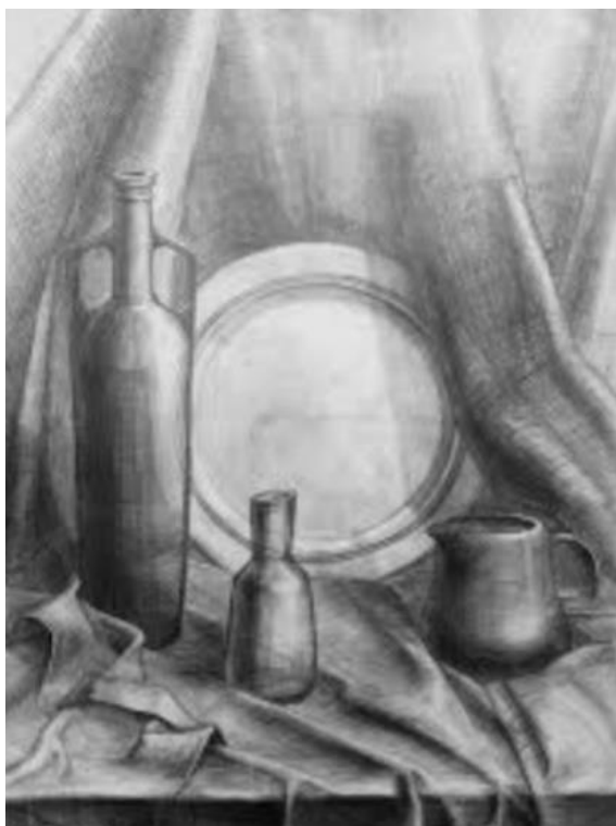
Рисунок 3. Натюрморт