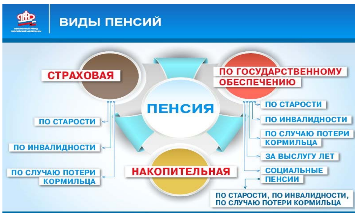
Рис. 2. Виды пенсий, выплачиваемых из ПФР [18]

В России основным администратором и фондораспорядителем пенсионной системы в настоящее время является Пенсионный фонд России. Из него, помимо ряда сопутствующих выплат (пособие на погребение, материнский капитал и проч.) выплачивается несколько видов пенсий, в том числе социальные, страховые трудовые, государственные (бывшие ведомственные) и профессиональные, и пенсии, выплачиваемые не за заработный труд, а за социальный статус (инвалид, мать военнослужащего, утративший кормильца, сирота и проч.). Виды пенсий, выплачиваемых из Пенсионного фонда, представлены на информационном слайде ПФР (рис. 2).