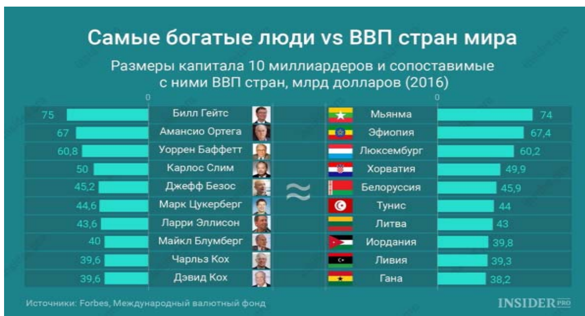
Рис. 5. Соотношение капиталов, находящихся в частных руках, и ВВП отдельных стран

За последние два года люди наверху данного списка несколько раз поменялись местами, но разве это что-то изменило для остальных? Нет. Если столь значительные по мировым меркам ресурсы сосредоточены в руках немногих, имеющих свое мнение на развитие мира и по большому счету неподконтрольных ни национальному, ни мировому сообществу, на что они могут быть направлены? Как знать. Судя по сложившемуся миропорядку, явно не на рост благосостояния всего населения. Недаром основная проблема господствующей экономической теории, очевидная не только советским политэкономам, – подмена научного предмета (реальной экономики – фиктивной) и стремление обосновать финансовый капитализм как высшую ступень социально-экономического развития. Какое значение это имеет для пенсий? Очень важное. Во-первых, именно социально-экономические знания в конечном счете определяют слова и поступки людей, владеющих ресурсами, облеченных государственной и корпоративной властью, осуществляющих в обществе управленческие функции. Более