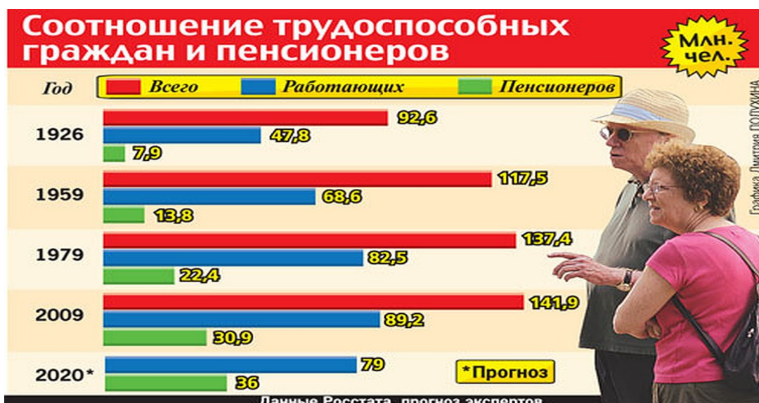
Рис. 4. Экспертный прогноз соотношения численности трудоспособных граждан и пенсионеров в России [19]