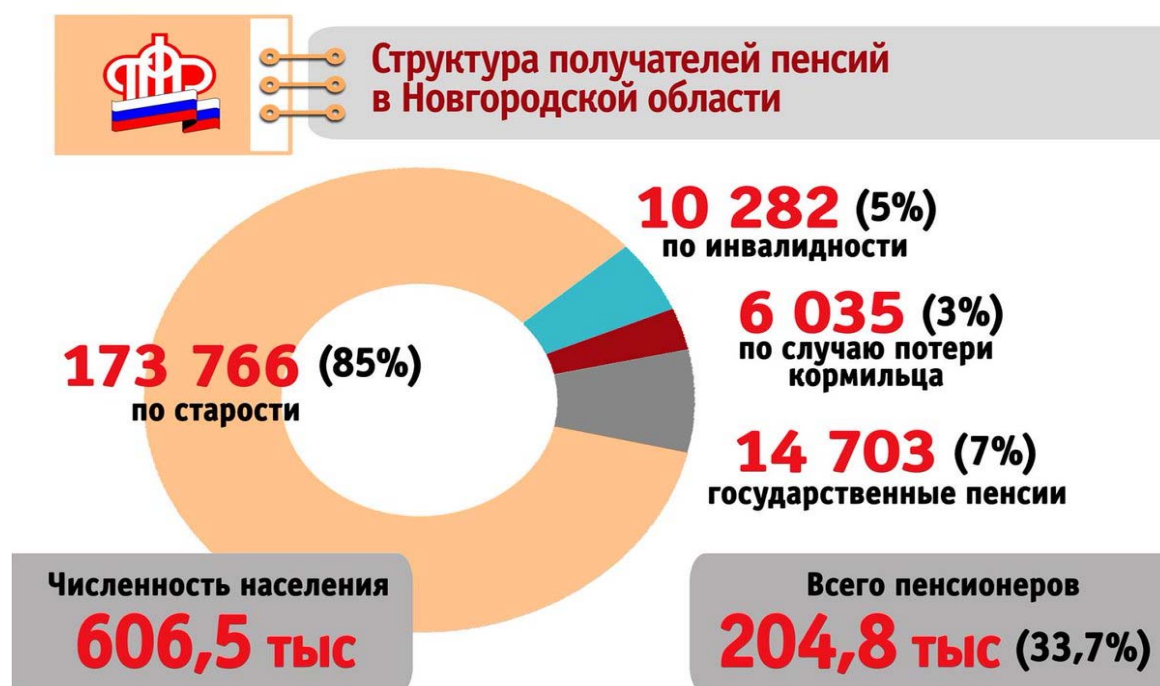
Рис. 3. Информационный слайд отделения ПФР по Новгородской области [18]

когорты – Новгородской области, которые представлены на информационном слайде ПФР (рис. 3).