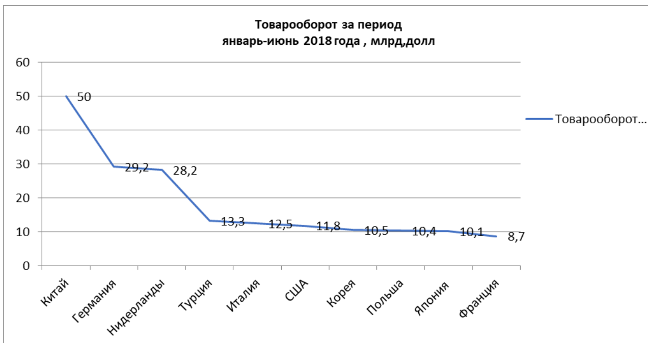
Рис. 2. Структура товарооборота за период январь-июнь 2018 г. по странам дальнего зарубежья

Структура товарооборота за период январь-июнь 2018 г. по странам дальнего зарубежья приведена на рис. 2 (расчеты автора на основе [7]).