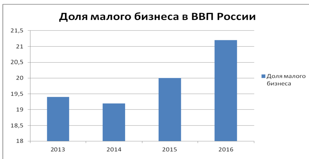
Рисунок. Доля малого бизнеса в ВВП России

При этом в РФ малый бизнес обеспечил в 2016 г. лишь 21,2 % ВВП (рисунок, сост. по [13]).