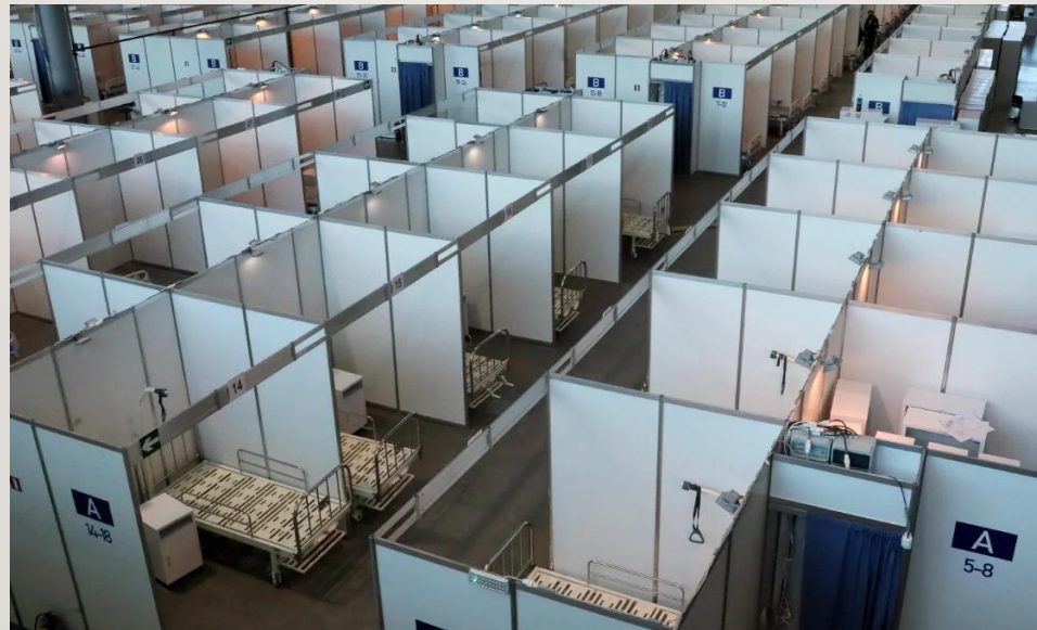
Госпиталь в павильонах Ленэкспо