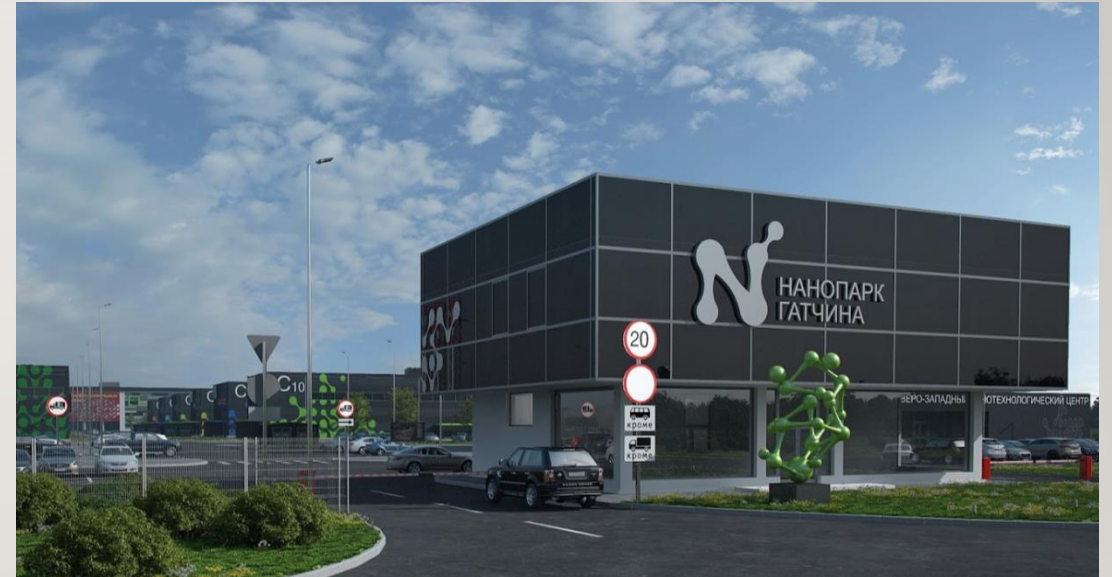
«Нанопарк Гатчина» – первый в России индустриальный парк в сфере нанотехнологий