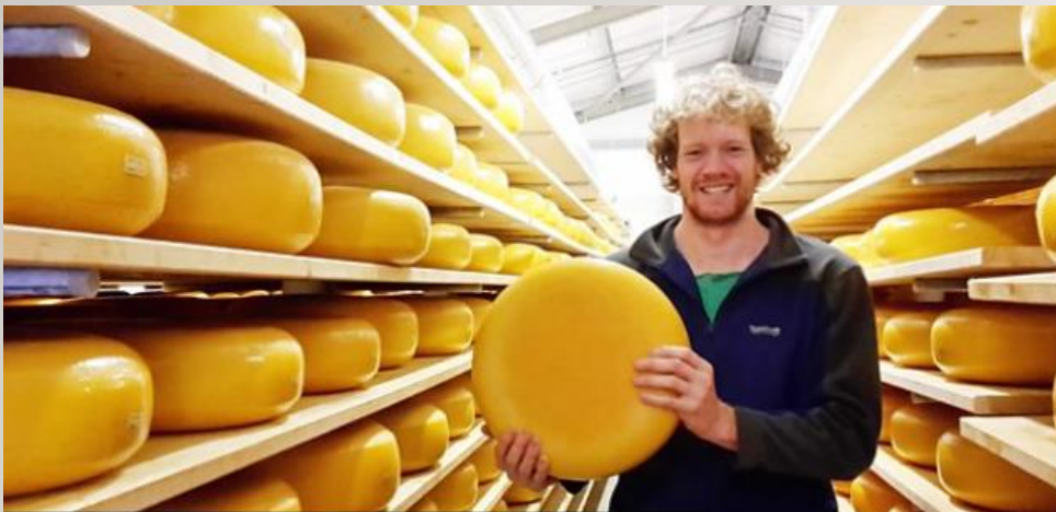
Семейная сыроварня в Корнуолле Голландия