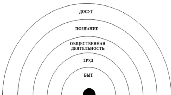
Рис. Сферы жизнедеятельности человека (по Н.П. Царевой)

Первичная базовая сфера – это сфера быта, определяющая и организующая условия человеческой жизни. Адаптация в быту заключается