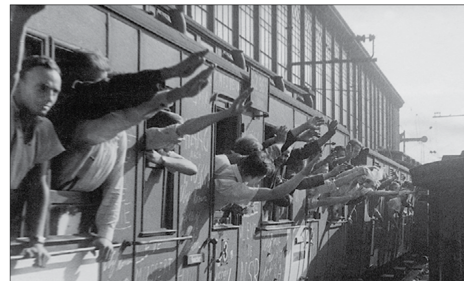
Голландские добровольцы едут на Восточный фронт.