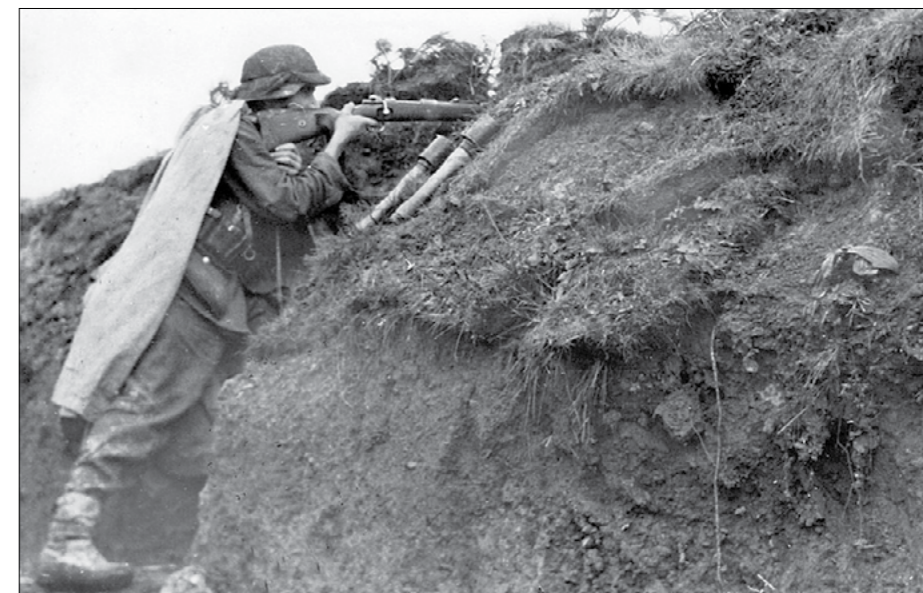
Румынский солдат на советской земле.