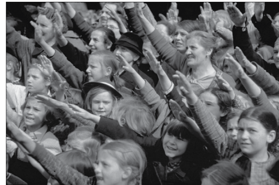
1938 год. Счастливые австрийки приветствуют Адольфа Гитлера во время кампании по аншлюсу, присоединению Австрии к Германии.