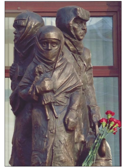
Памятник детям блокадного Ленинграда в Омске.