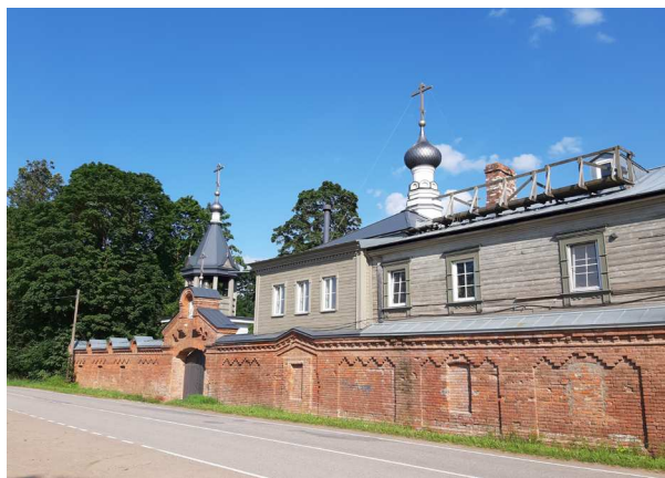
Рис. Фото Пятогорского Богородицкого женского монастыря в д. Курковицы Волосовского района, где находился в 1942–1944 гг. Детский дом.