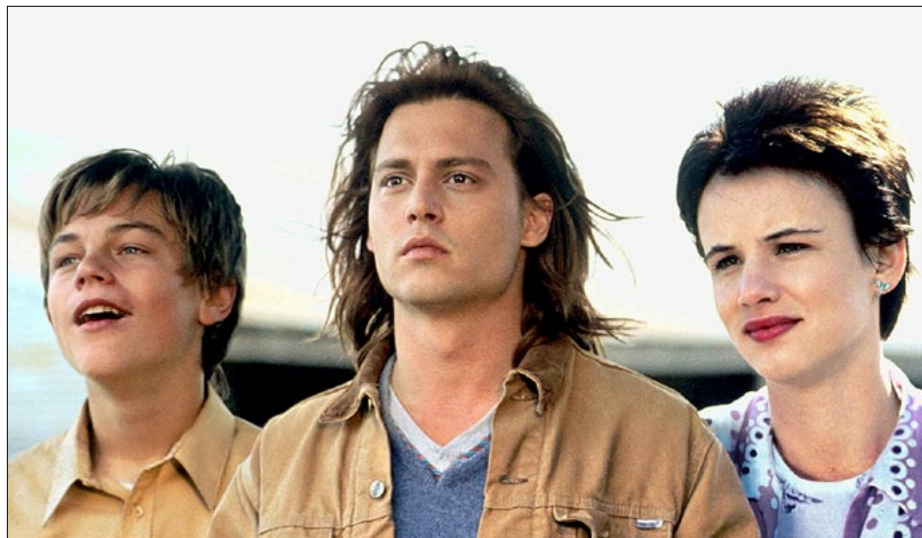
Кадр из фильма «Что гложет Гилберта Грейпа».

— К нам студенты могут прийти, чтобы посмотреть интересный фильм, найти новых друзей или просто весело провести вечер. Перед началом просмотра мы даем немного информации о фильме, приводим какие-то интересные факты, рассказываем про режиссера и актеров. После сеанса обязательно делимся впечатлениями от увиденного, каждый может высказать свое мнение и послушать, что думают другие. О том, какой фильм стоит показать первым, мы думали довольно долго. Провели опрос среди наших друзей и знакомых. Так и получилось, что на первом кино вечере мы смотрели мультфильм «Бесподобный мистер Фокс» режиссера Уэса Андерсона.