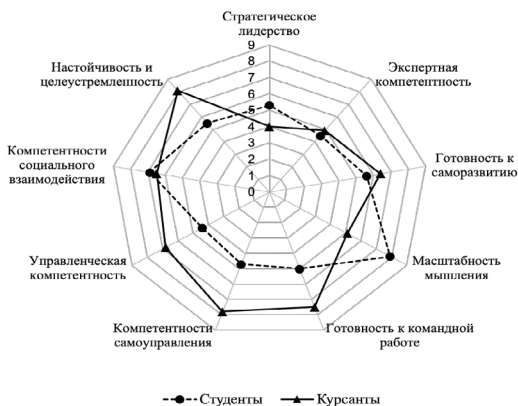
Рис. 1. Сравнительный анализ уровня развития лидерских способностей студентов (n=58) и курсантов (n=54)

По результатам сравнительного анализа выявлены значимые различия по t-критерию Стьюдента при \alpha=0,01 в уровне развития некоторых показателей лидерских способностей студентов и курсантов.