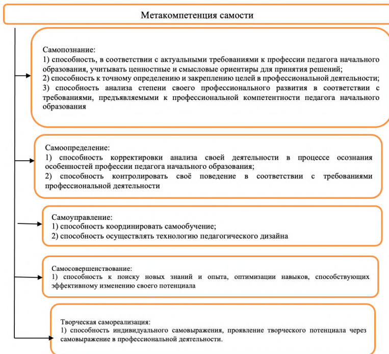
Рис. 2. Структура метакомпетентности самости педагога начального образования

результатом профессионального саморазвития, становится его стимулом, так как личностные изменения педагога начального образования вызывают потребность в самосовершенствовании.