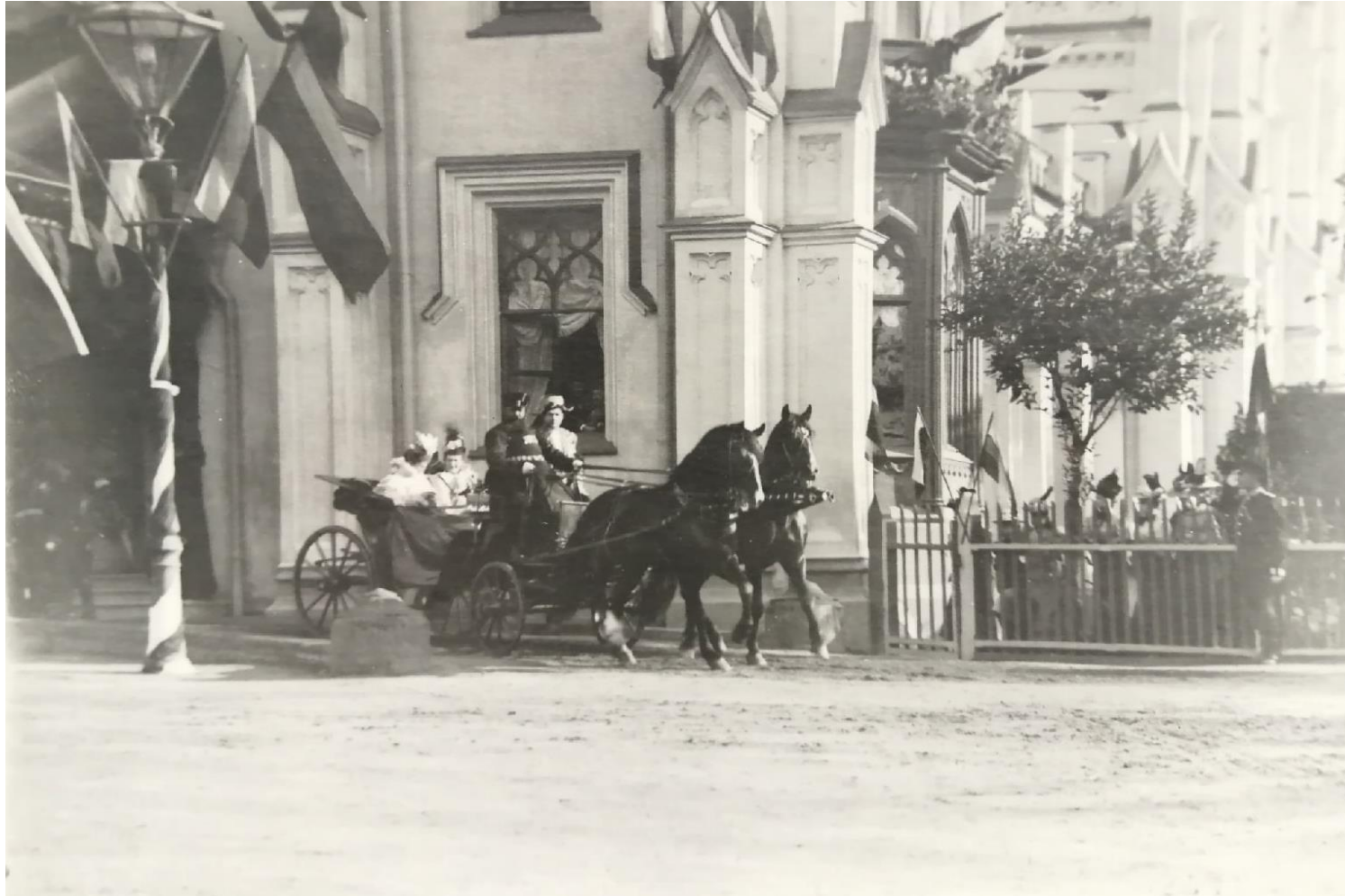
Д – 17139.

Фотография. В одной коляске Великая княгиня Мария Павловна (Старшая) и болгарская княгиня Мария Луиза. Петергофский вокзал. 9 июля 1898 г.