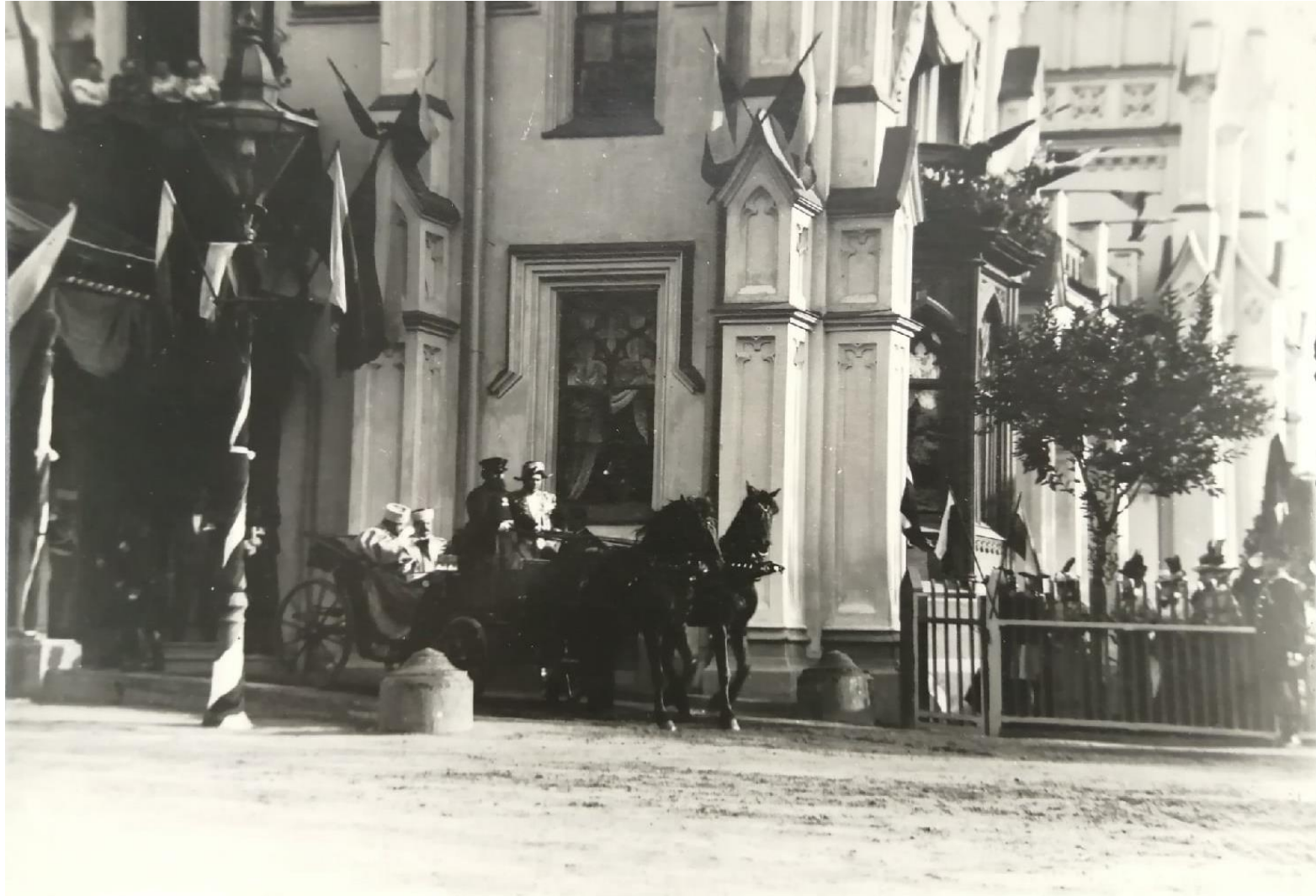
Фотография из архива ЦГАКФФД СПб. Д – 17140

Фотография. Великий князь Владимир Александрович и болгарский князь Фердинанд Кобургский. 9 июля 1898 г.