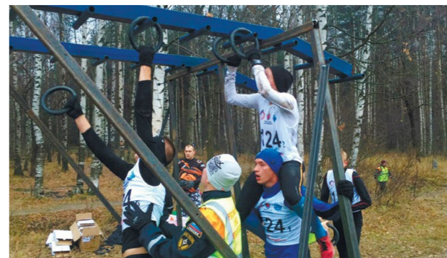
«Гонка ГТО»: преодоление препятствий.

Результат для наших студентов весьма успешный. Команда продемонстрировала сплоченность и полную самоотдачу. Важно понимать, что для успеха в общекомандном зачете чрезвычайно значимы призовые места в разных дисциплинах, так как они дают больше всего очков для командного зачета. Но и спор-