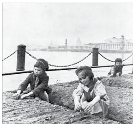
И родная мать у сына Для себя кусок стаццла...