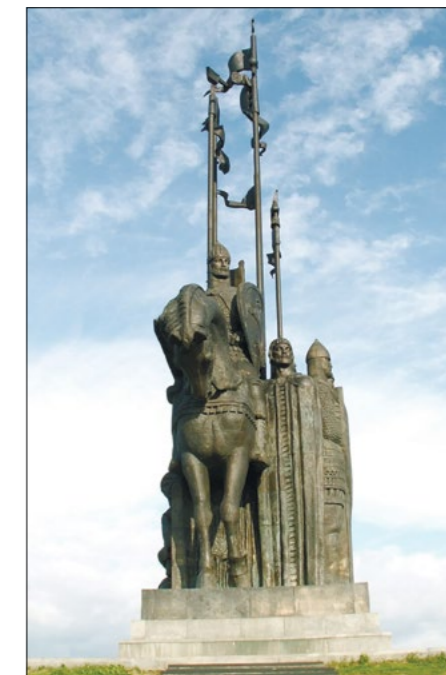
Памятник Александру Невскому и русским воинам на горе Соколик в Псковской области.