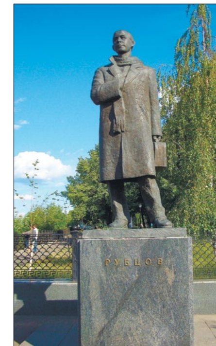
Памятник Н.Рубцову в Вологде.