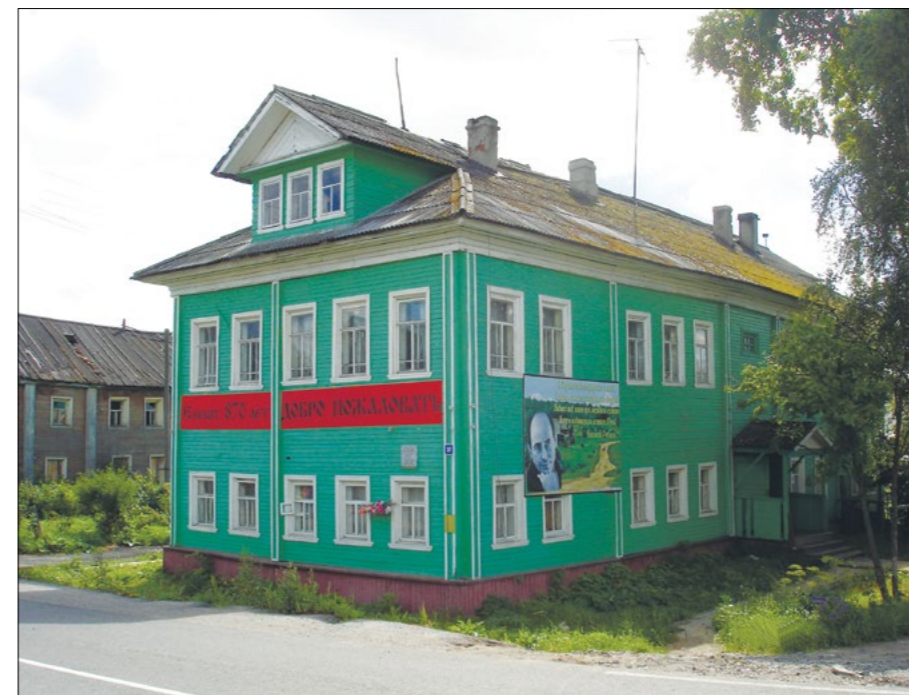
Дом в селе Емецк Холмогорского района Архангельской области, где родился Н.Рубцов.