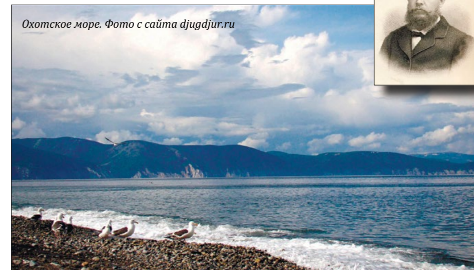
Охотское море.

лук и стрелы: заряды для ружья следовало беречь. И они пригодились, когда в избушку попыталась ворваться стая голодных волков. Восьмерых он подстрелил, а потом еще подкараулил и медведя... Теперь можно было спать на волчьих шкурах и укрываться медвежьей в холодные ночи. С едой особых проблем не было: медвежатины хватало надолго, а еще в силки попадались птицы, да и рыбы вокруг острова хватало.