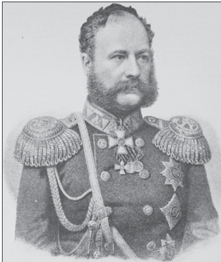
А.И. Бяратинский.

На следующий день Петербург гудел, подобно улью, — все передавали друг другу ошеломляющие подробности о содержимом конверта. Ока-