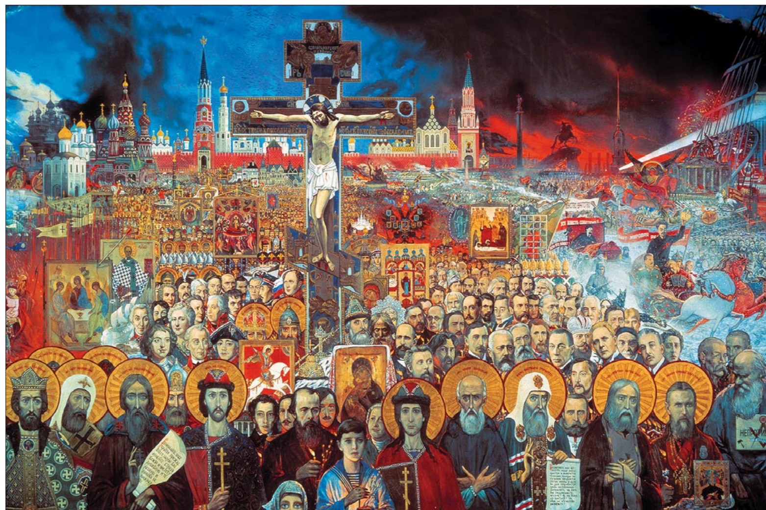
«Вечная Россия». Фрагмент картины И.С. Глазунова

— А что вы думаете про преподавание норманнской теории?