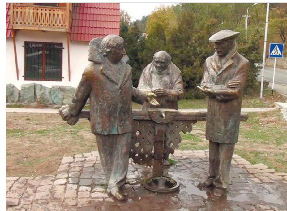
Памятник героям фильма «Мимино» в городе Дилижан (Республика Армения).