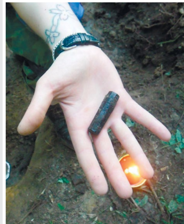
Медальон на ладони Полины Клюквиной.