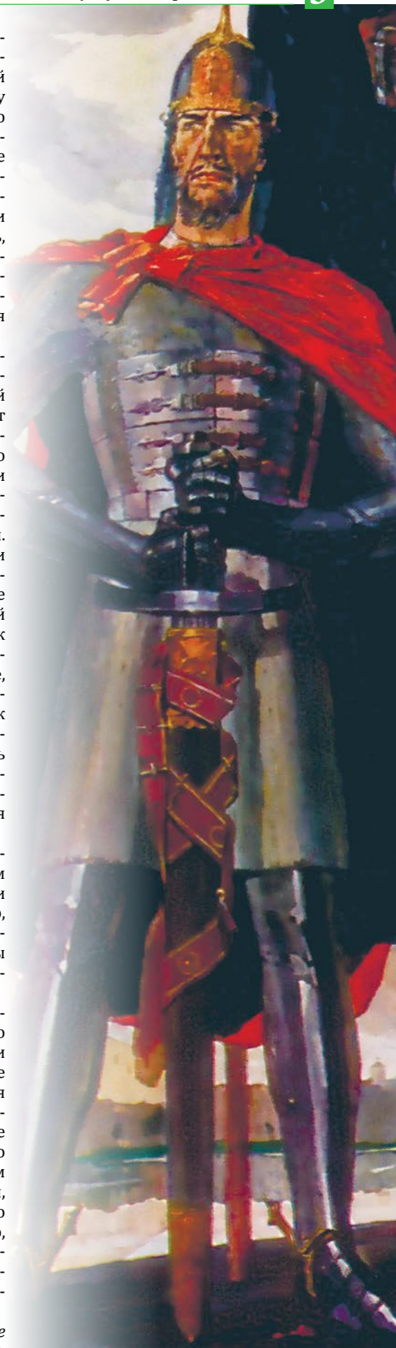
Александр Невский. Художник П.Д. Корин

Продолжение читайте в следующем номере. Беседовала Екатерина Рыбинская