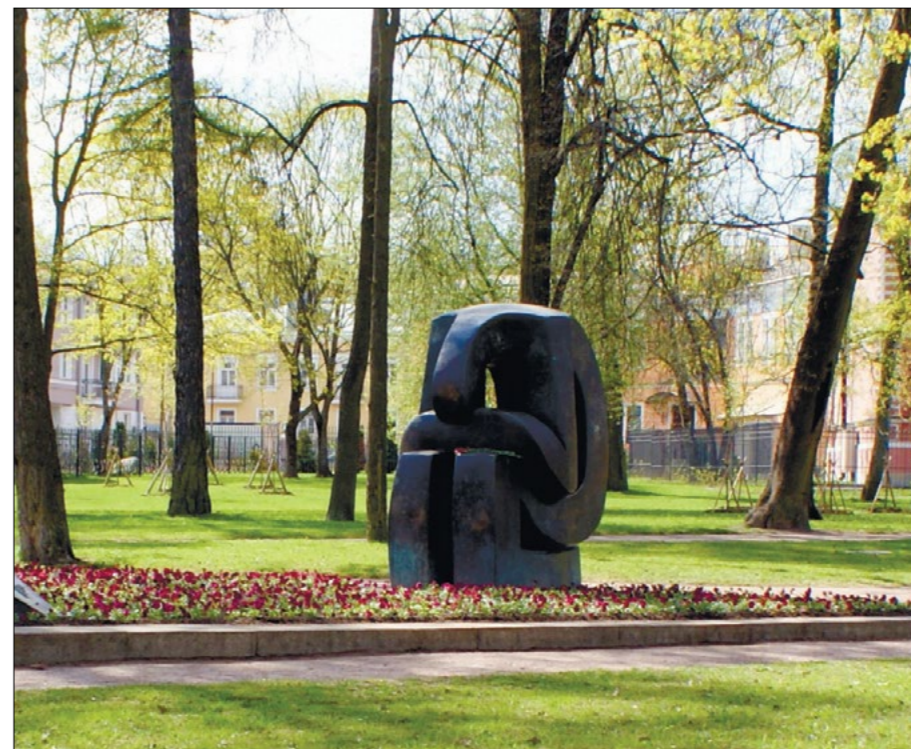
Мемориальный комплекс «Формула скорби» у входа в Александровский парк.

В первые месяцы оккупации немцы относились к жителям Пушкина как к рабам — окликали людей свистом, отбирали одежду, били кнутом и расстреливали без причины. Женщины старались не выходить из своих домов, потому что фашисты могли их изнасиловать. Въезд в город осуществлялся только по пропускам, регулярно проводилась перепись населения. К евреям в годы оккупации немцы относились особенно жестоко. Почти все они были расстреляны, выжить удалось единицам.