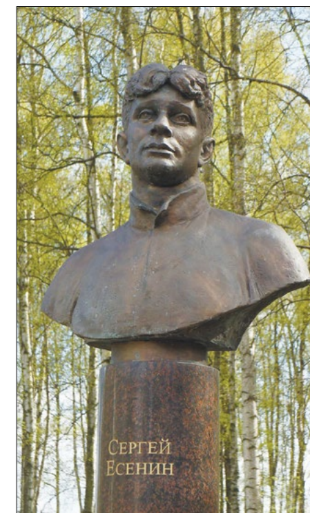
Памятник поэту в парке имени Есенина, Санкт-Петербург.

Сегодня Сергей Есенин — один из самых читаемых поэтов после Пуш-