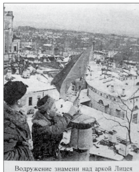
Водружение знамени над аркой Лицея

Двумя днями ранее в Екатерининский дворец попали два снаряда. Один упал на купол, другой — в центральную часть дворца. В результате бом-