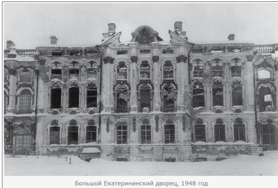
Большой Екатерининский дворец, 1948 год

История города Пушкина — это не только история создания его дворцов, парков, скверов. И не только история русской литературы и поэзии. Это еще и великий подвиг, совершенный жителями нашего города в годы Великой Отечественной войны.