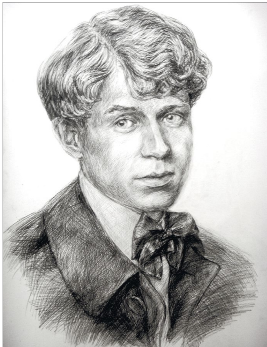
Сергей Есенин. Рисунок Анастасии Забродиной (creative.su)

По воспоминаниям самого поэта, бабушка с дедушкой оказали огромное влияние на его духовное развитие.