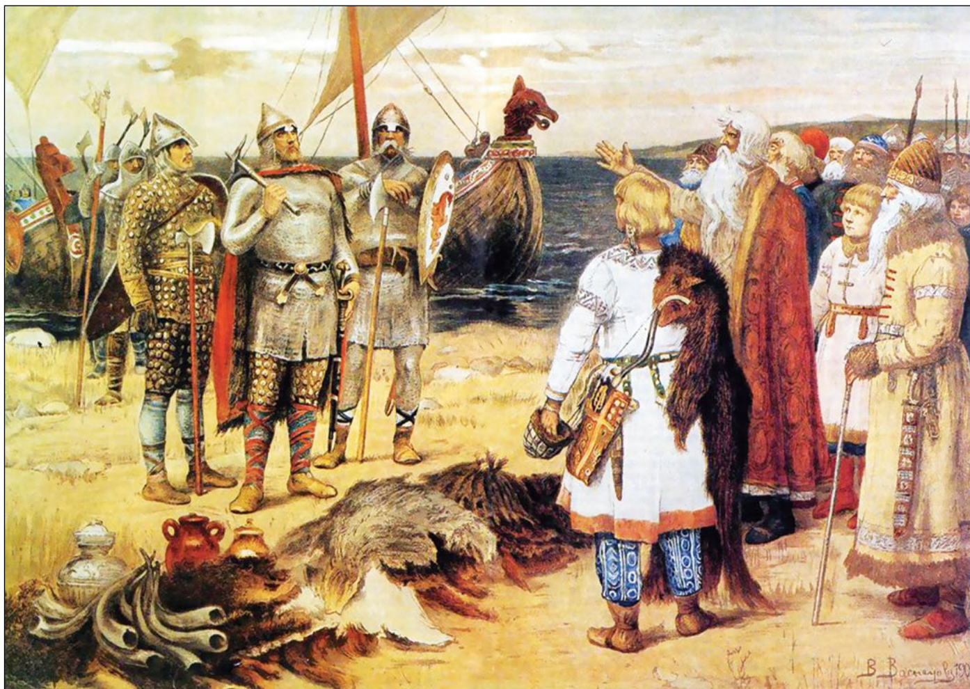
Призвание варягов. Картина художника В.М.Васнецова.

возникать очередные утопии придуманной истории о том, что предки шведов в лице шведо-гипербореев и шведо-готов были изначально в Восточной Европе. И это оказалось также попыткой создать новейшую концепцию истории восточной Европы. Данный миф продолжал развиваться в обстановке Столбовского мира, когда еще важнее стало доказать, что шведы всегда находились на славянских землях, а русские, славяне «подошли попозже». Тогда же, между прочим, придумали и концепцию этнической карты Восточной Европы в древности, которая продолжает фигурировать в науке и по сей день. Эта карта якобы показывает, как из древней Швеции-Гиперборей выходят и плывут по восточно-европейским рекам предки шведов, подчиняя исконное население этих земель, которым были финны. А славяне-русские пришли на земли восточной Европы позже всех. Этот миф живет в науке до сих пор. Еще более актуален он стал после поражения шведов в Северной войне, когда русские земли снова стали принадлежать России. И шведы не оставляли попыток вернуть эту территорию до начала XIX века: в результате потеряли и Финляндию.