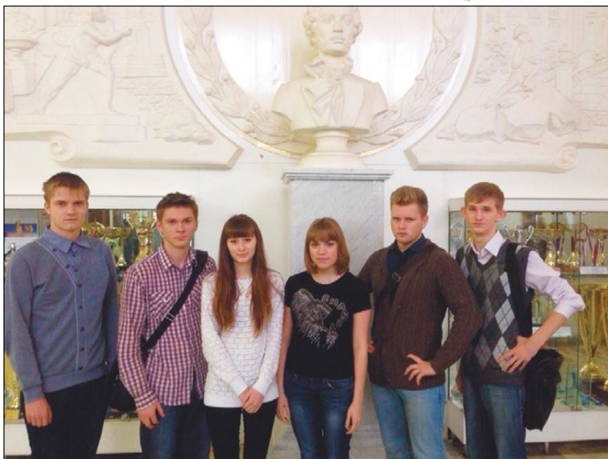
На снимке: члены команды ЛГУ им. А.С.Пушкина.