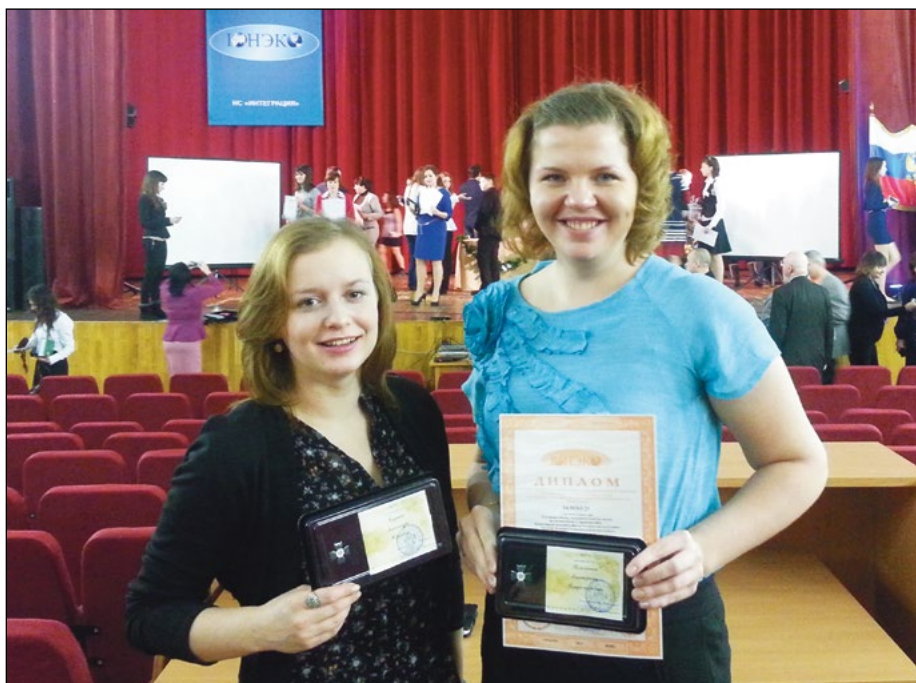
На снимке: победители конкурса «ЮНЭКО-2013».