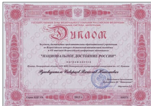
Награды VII Всероссийского конкурса достижений талантливой молодежи «Национальное достояние России».