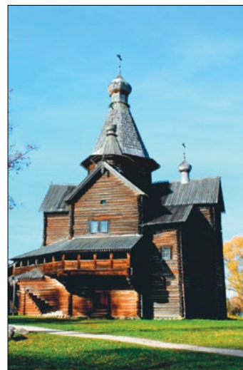
Один из деревянных храмов Великого Новгорода