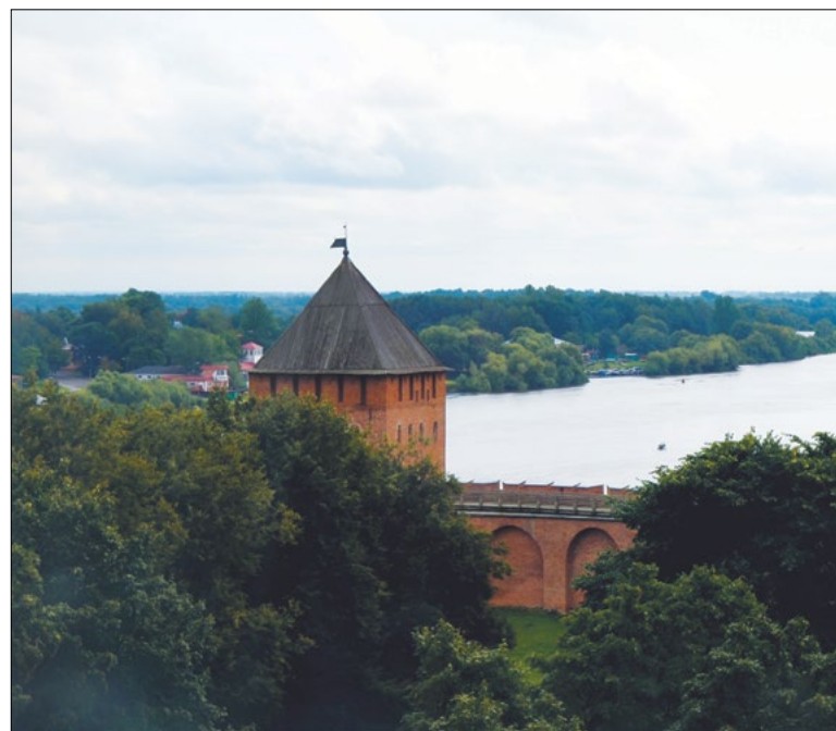
Новгородский кремль – жемчужина древнерусской архитектуры