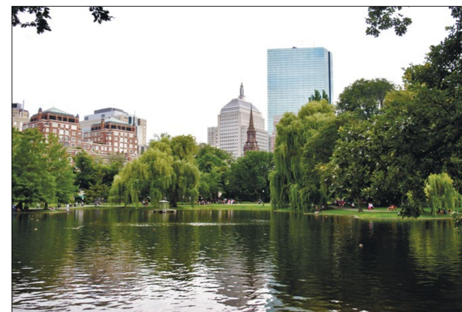
На снимках: памятник Джорджу Вашингтону; городской парк Public Garden. Панорама Бостона