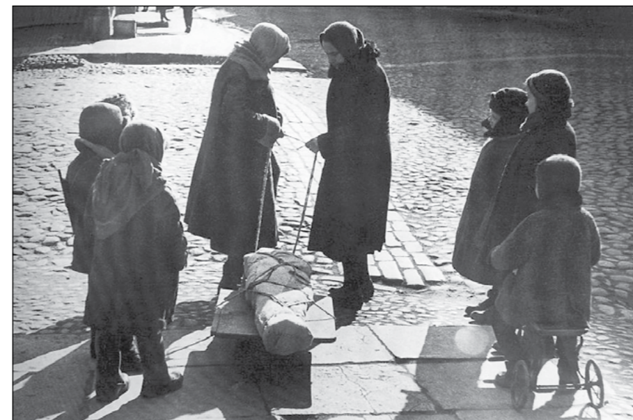
Всеволод Тарасевич. Ленинградки везут труп к месту захоронения. 25 апреля 1942 года.

Приглашаем вас 13 ноября на праздник красоты и таланта!