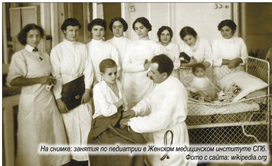
На снимке: занятия по педиатрии в Женском медицинском институте СПб.