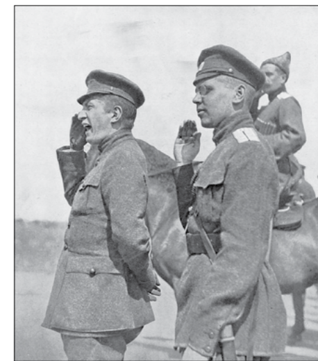
А.Ф. Керенский на военном смотре.

После неудачного «мятежа» был заключен под стражу, но 19 ноября освобожден. Под чужим именем выехал в Новочеркасск, где вместе с генералами Алексеевым, Деникиным и атаманом Калединым приступил к созданию Белой армии. Выступил на занятый большевиками Екатеринодар (ныне Краснодар). Первая попытка взять город оказалась неудачной. 12 апреля 2018 года Лавр Георгиевич отдал приказ о повторном наступлении. Утром следующего дня единственный снаряд, разорвавшийся в станице Елизаветинской, пробил стену дома, где располагался