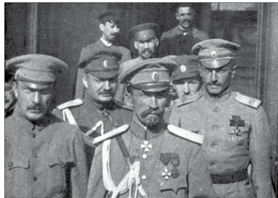
Генерал Л.Г. Корнилов с офицерами своего штаба.

...Как такового мятежа не было. Керенский искал союзника в борьбе с большевиками. Лучшей кандидатуры, чем Корнилов, не нашлось. Что случилось потом, когда они уже обо всем договорились? То ли Керенский понял, что он потеряет власть, то ли ему что-то наплел князь Львов, презираемый обществом не только за тупость и под-