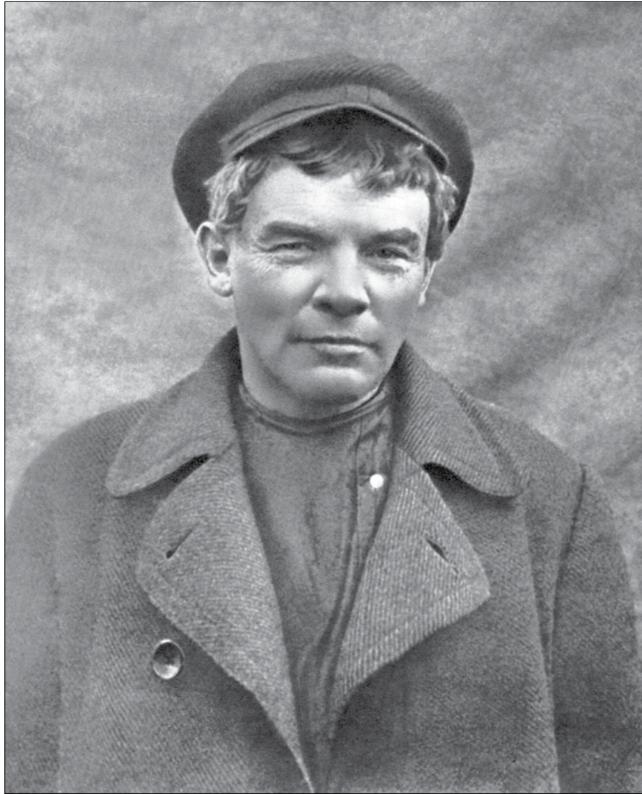
В.И. Ленин в гриме и парике, август 1917 года.

Как бы кто не относился к Владимиру Ильичу, но вряд ли он будет отрицать, что Ленин — один из самых великих людей прошлого века. Почти сто лет его называют руководителем революции, что весьма спорно. В конце 1916-го он даже заявил: «Наше по-