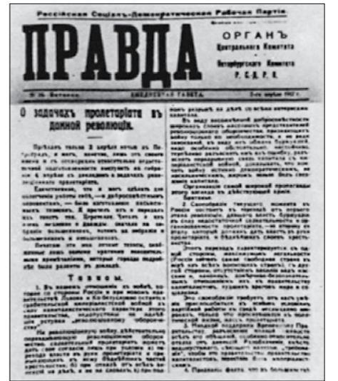
Номер газеты «Правда» с напечатанными «тезисами».

мист Николай Николаевич Суханов (наст. фамилия Гиммлер), оставшийся весьма противоречивые «Записки о революции», был эсером, потом меньшевиком, потом вступил в германскую коммунистическую партию, хотел вступить и в ВКП(б), но его не приняли. Арестован в 1930 г., расстрелян как немецкий шпион в 1940 г. Примечательно, что отец Суханова, не получив в свое время у церкви согласия на развод, по уговору с женой инсценировал свое самоубийство, чтобы жена смогла выйти замуж за любимого человека. За это оба они были приговорены к тюремному сроку, который обоим заменили на ссылку... Об этом сообщали почти все русские газеты. Льва Николаевича Толстого так увлекла эта история, что он написал по ее мотивам пьесу «Живой труп».