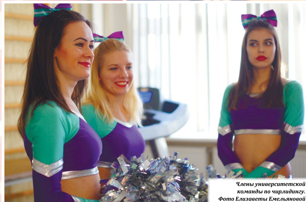
Члены университетской команды по чирлидингу.