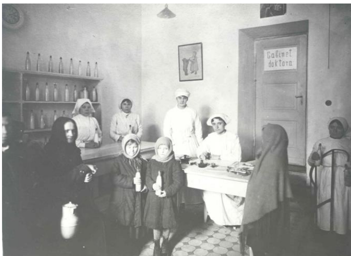
Работники пункта «Капля молока» выдают молоко