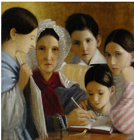
Портрет семьи Енатских (1839)

Орловский музей изобразительных искусств