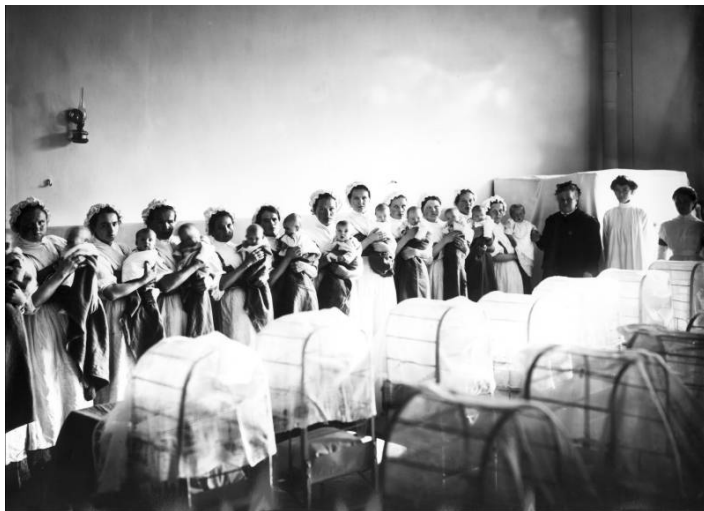
Няни с детьми на руках в грудном отделении Императорского Воспитательного дома Е 15386.