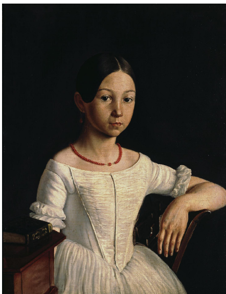
Портрет Лидии Николаевны Милюковой (1840-е)