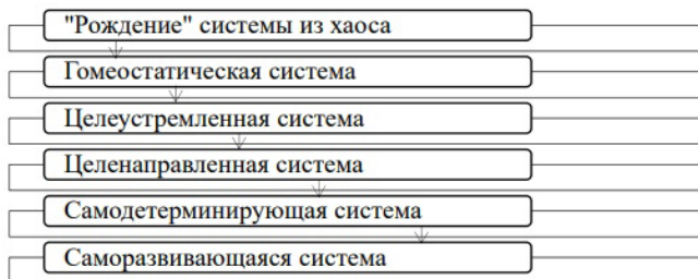
Рис. 1. Схематическое изображение структуры системно-эволюционной концепции развития личности (самоорганизации системы), по В. В. Белову

Синергетический подход хорошо иллюстрирует идею траекторий развития личности в период юности, но не дает представления об этапах эволюционного развития системы. Для разработки представления об этапах развития, мы обратились к системно-эволюционному подходу развития личности В. В. Белова, которым была предложена идея этапов развития систем, низшим уровнем развития которой будет являться «рождение» системы из хаоса», а высшим – «саморазвивающаяся система» (рис. 1) [5, с.18].