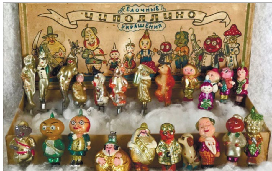
Набор советских елочных игрушек «Чиполлино» (1950-е годы)

Сама по себе традиция украшать елку возникла как отклик на христианские сюжеты, где ель — символ райского дерева, которое нужно наряжать плодами. Также украшали ее пряниками и разноцветными свечами. Популярность елки стремительно росла, и уже в 1850-е годы их начали ставить не только на главных площадях столиц, но и в крупных губернских городах. Нарядить елки начинают богатые городские семьи, поэтому возникает потребность в игрушках. Вначале они были тяжелыми и непрозрачными, но вскоре появляются фигурки из стекла, украшения из картона —