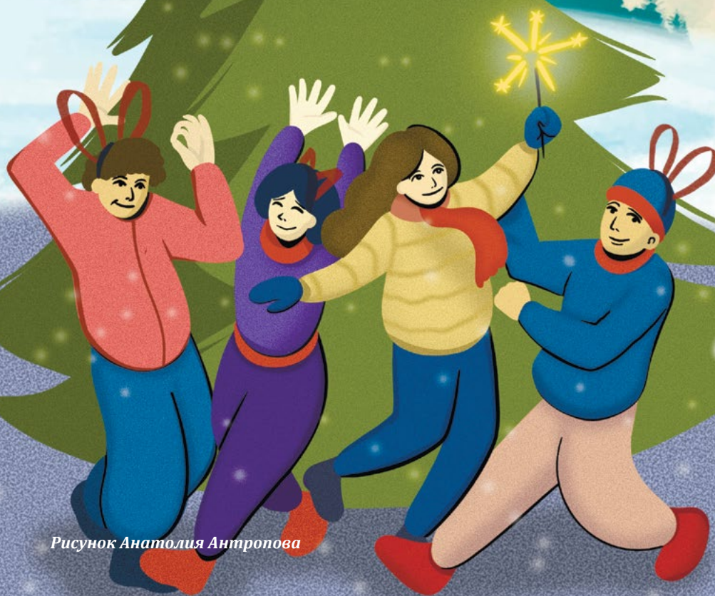
Рисунок Анатолия Антропова