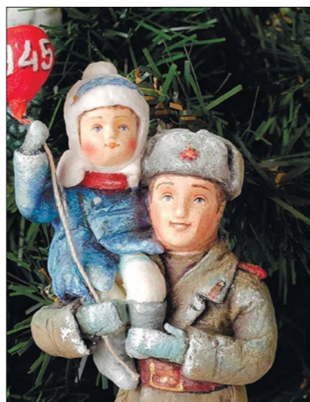
Советская послевоенная елочная игрушка из папье-маше

После революции 1917 года в советском государстве была объявлена борьба с религиозными предрассудками и пережитками прошлого. Под запрет попала и новогодняя елка. Возвращение ее в наши дома приходится на вторую половину 30-х годов, елка превращается в новогоднее украшение, традиция теряет изначальный христианский смысл. Игрушки в это время меняются: это уже не скромные