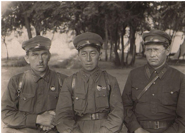
Комбриг Миршарапов Миркамил (Мир Камиль) (в центре), командир отдельной бригады гор- ских национальностей, май 1936 г.