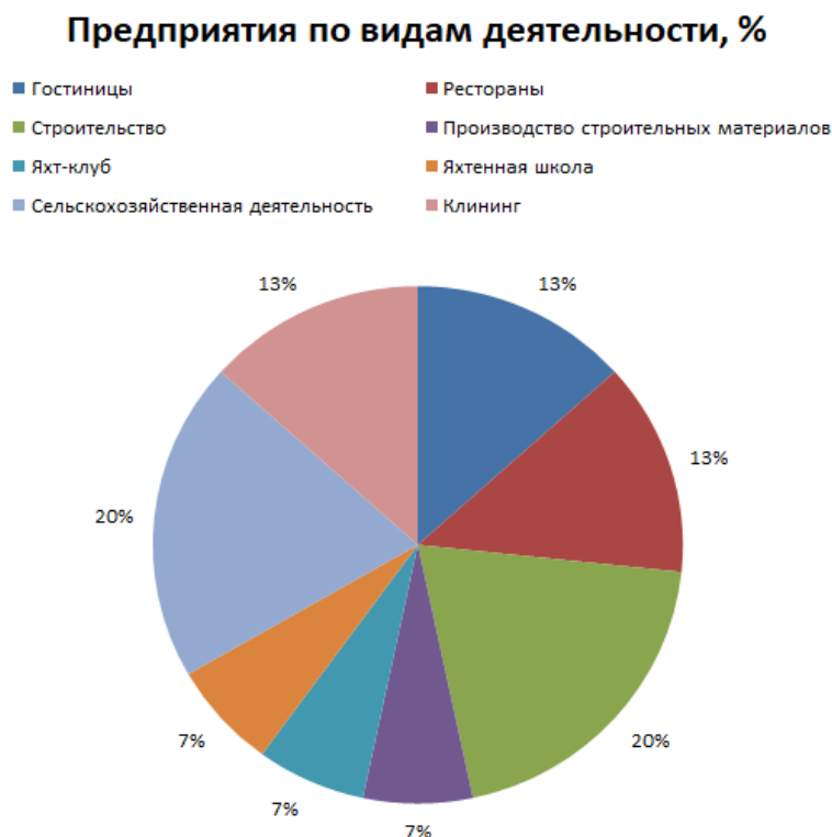
Рис. 2. Предприятия по отраслям, топ-менеджеры и предприниматели которых участвовали в исследовании