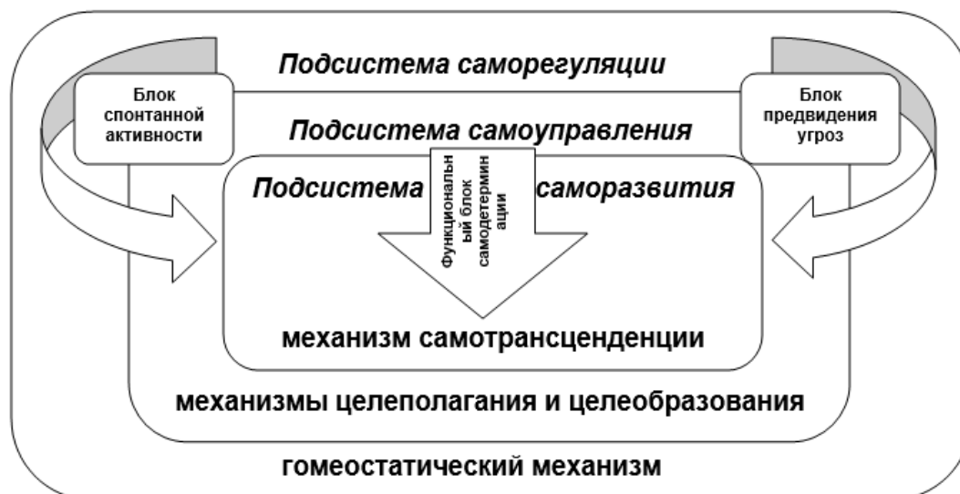
Рис. 1. Трехкомпонентная модель личности созидающего организационного лидера, по В.В. Белову

Рассмотрим трехкомпонентную модель личности созидающего организационного лидера, изображенную на рис. 1. Представленная структура включает в себя три подсистемы: саморегуляцию, самоуправление и саморазвитие. В основе каждой из них лежит свой механизм действия: на уровне саморегуляции – гомеостатический механизм, на уровне самоуправления – механизм целеполагания и целеобразования, на уровне саморазвития – механизм самотрансценденции.