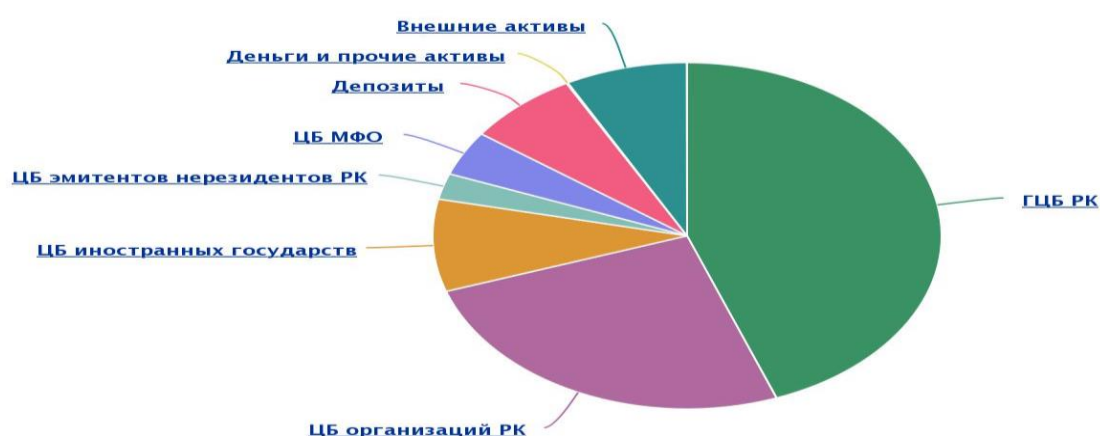
Рис. 3. Структура инвестиционного портфеля финансовых инструментов, сформированного за счет пенсионных активов ЕНПФ за 2020 г.

накоплений к объему ВВП РК за 2020 г. составило 18,4%, размер пенсионных активов фонда составили 12 894,60 млрд тенге. После реформы пенсионной системы (1998 г.), предполагалось, что пенсионные активы будут способствовать развитию рынков капитала в Республике Казахстан. Однако на практике все оказалось далеко не так, так по итогам 2020 г. основные направления инвестирования представлены следующим образом, отобразим на рис. 3.