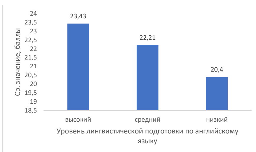
Рис. 3. Сравнение средних значений показателя избирательности внимания у обучающихся с разным уровнем лингвистической подготовки по английскому языку

Следовательно, способность настроить внимание, при наличии помех, на восприятие информации без допущения ошибок играет важное значение при изучении иностранного языка.