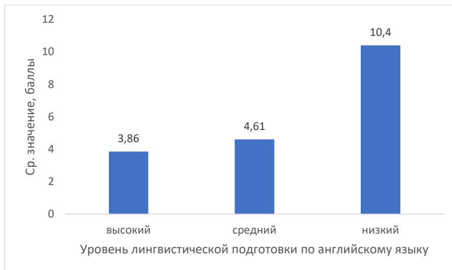
Рис. 2. Сравнение средних значений показателя интеллектуальной лабильности у обучающихся с разным уровнем лингвистической подготовки по английскому языку

Изучение избирательности внимания осуществлялось с помощью методики Мюнстерберга. Были выявлены различия значений данного показателя при сравнении школьников с высоким, средним и низким уровнем лингвистической подготовки. Обучающиеся с высоким уровнем лингвистической подготовки по английскому языку обладают существенно более высоким уровнем внимания, чем их одноклассники со средним и низким уровнем (рис. 3).