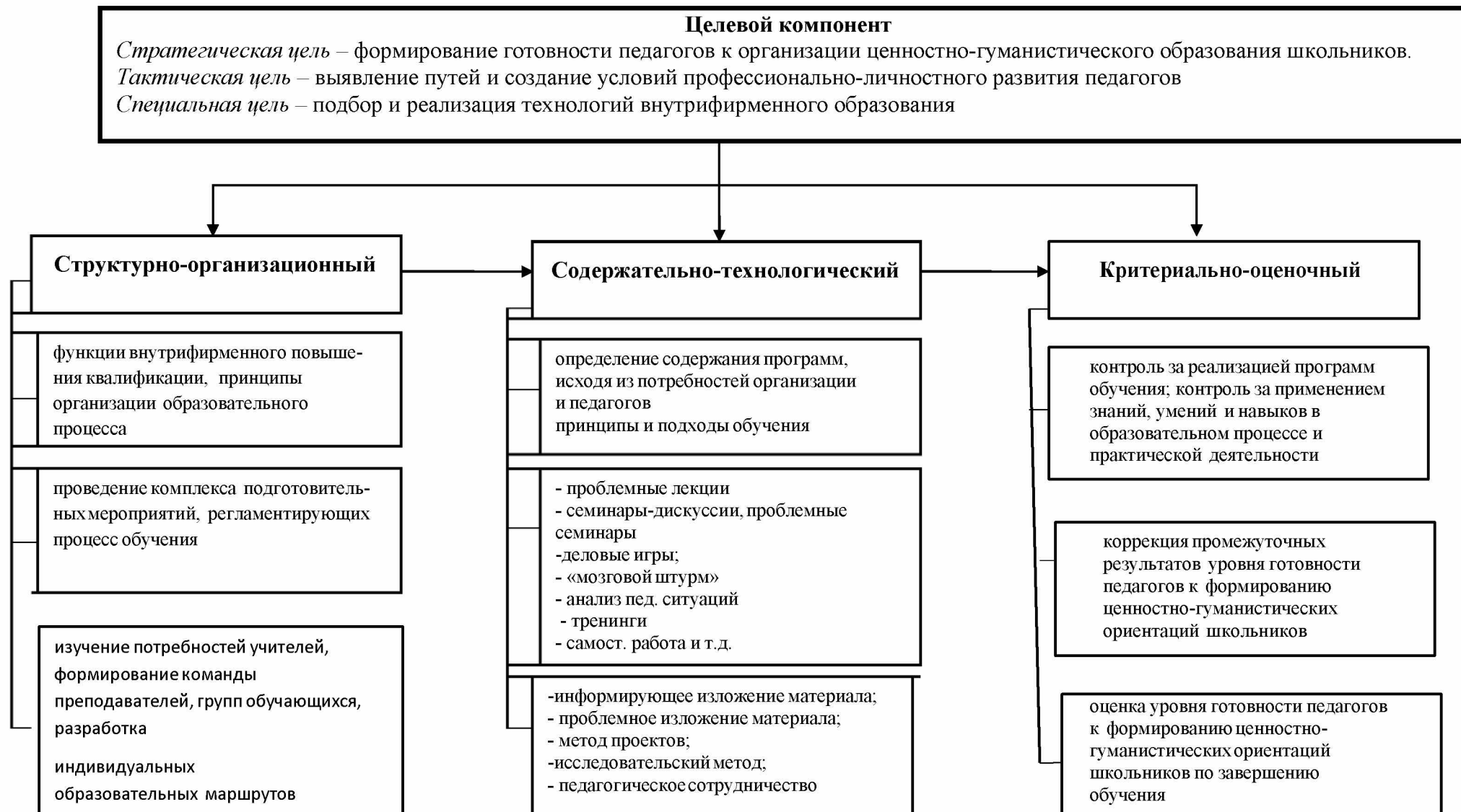
Рисунок 1. Модель внутрифирменного обучения педагогов